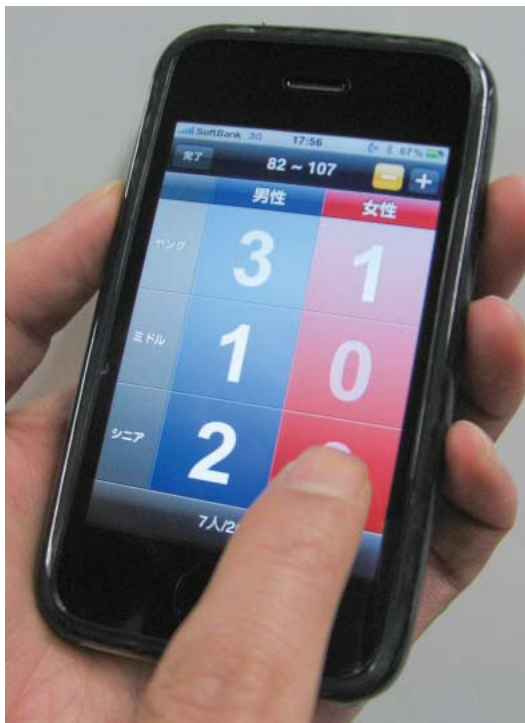
頭取りのデータはiPhoneやiPod touchといった携帯端末で入力。入力データは、ネットワークで結ばれた本部やホールへその場で送信可能