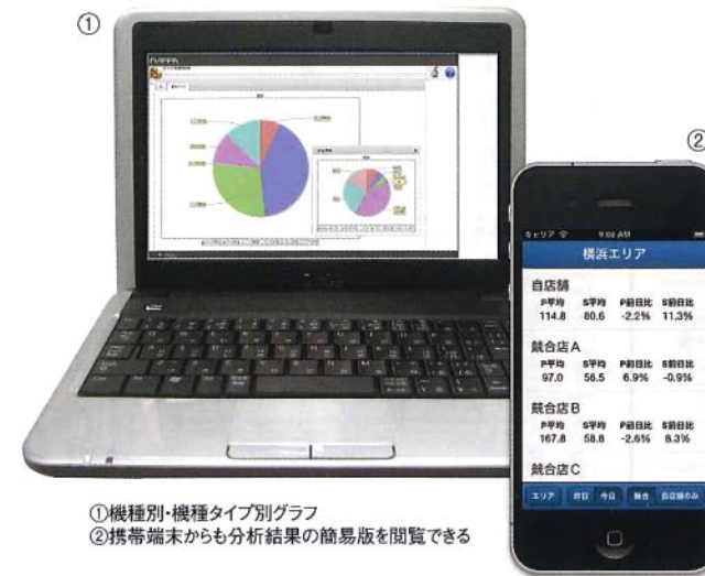
①機種別・機種タイプ別グラフ ②携帯端末からも分析結果の簡易版を閲覧できる

客数・客層調査分析システム『NAPPA』は、頭取りしたデータを元に営業力強化に役立つさまざまな分析が可能だ。ファン人口が大幅に減少する中、頭取りによるMR(Market Reserch=市場調査)を重視するホールが増えている。(株)ワイズコーポレーション(本社=埼玉県朝霞市)は2013年12月、系列店7店舗すべてに『NAPPA』を導入。ターゲットに応じた、きめの細かな営業戦略に活用している。